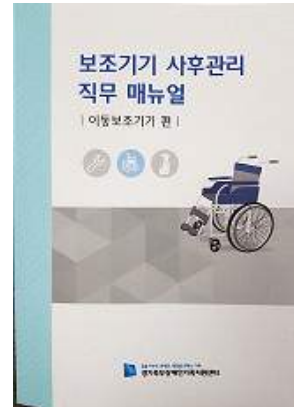
[이동보조기기 사후관리직무 매뉴얼-당사자용]