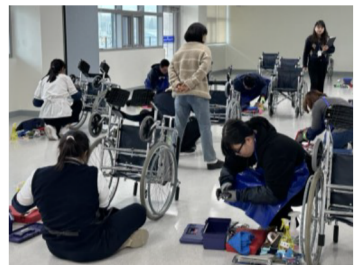
< 자격시험 운영 모습 >