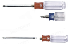
드라이버 양용(+, -), 주먹