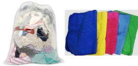
걸레 2종 (막걸레, 소독걸레)