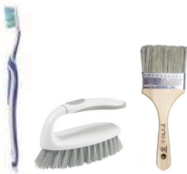
세척솔 3종 (칫솔, 청소솔, 붓솔)