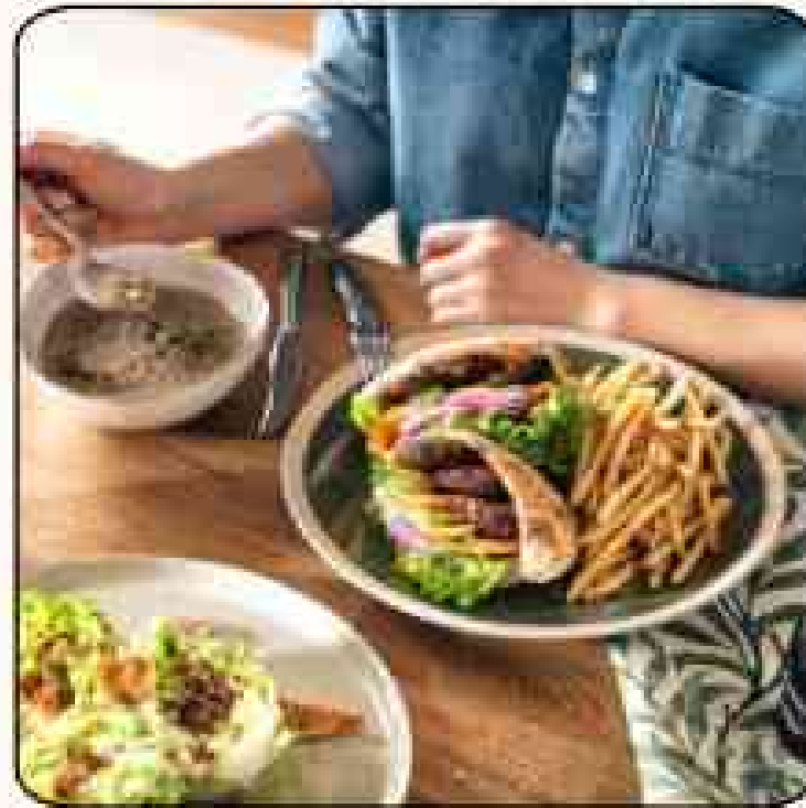
가든 팜 카페