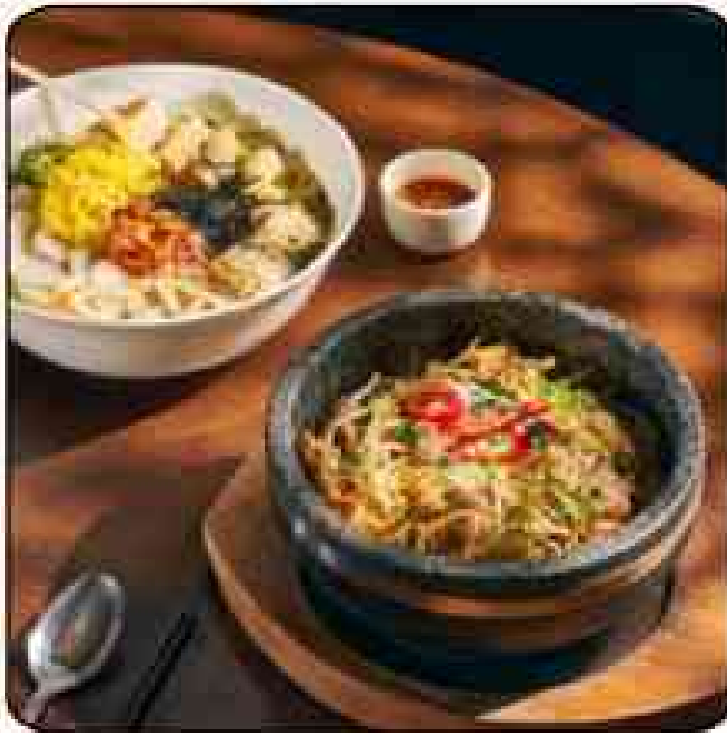
하이파이 코리안 소울 푸드