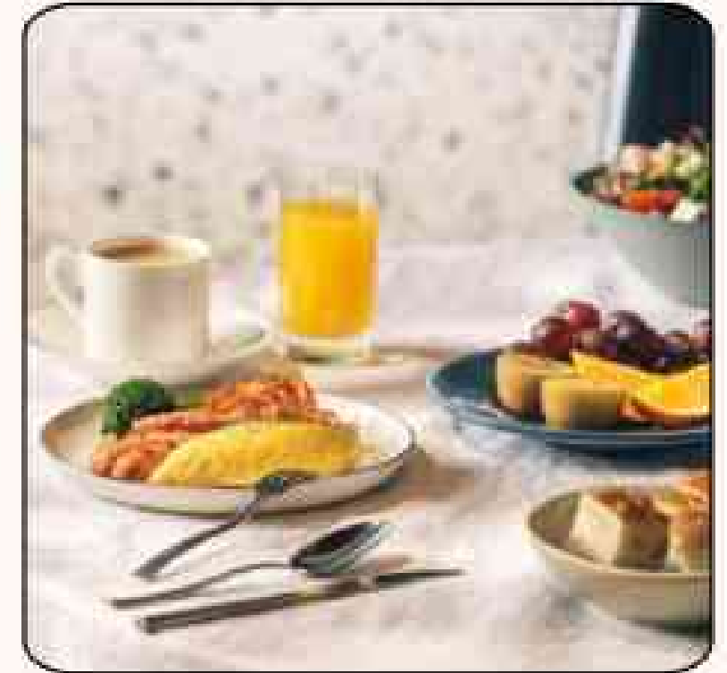
식사 바우처 & 호텔 조식