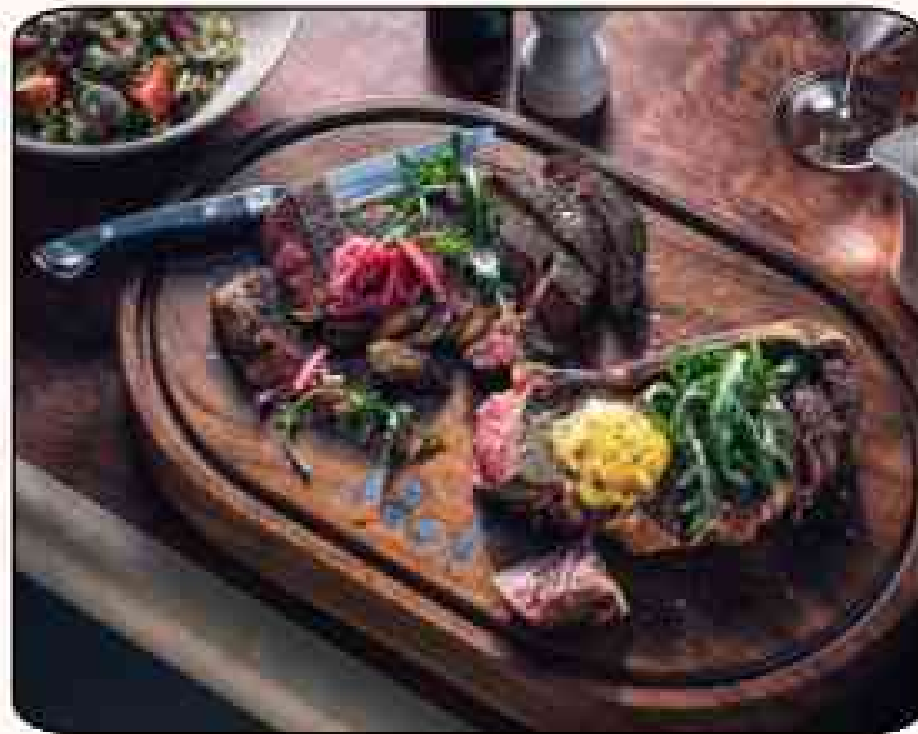
마이클 조던 스테이크 하우스 📍 시그니처 레스토랑 (1층)