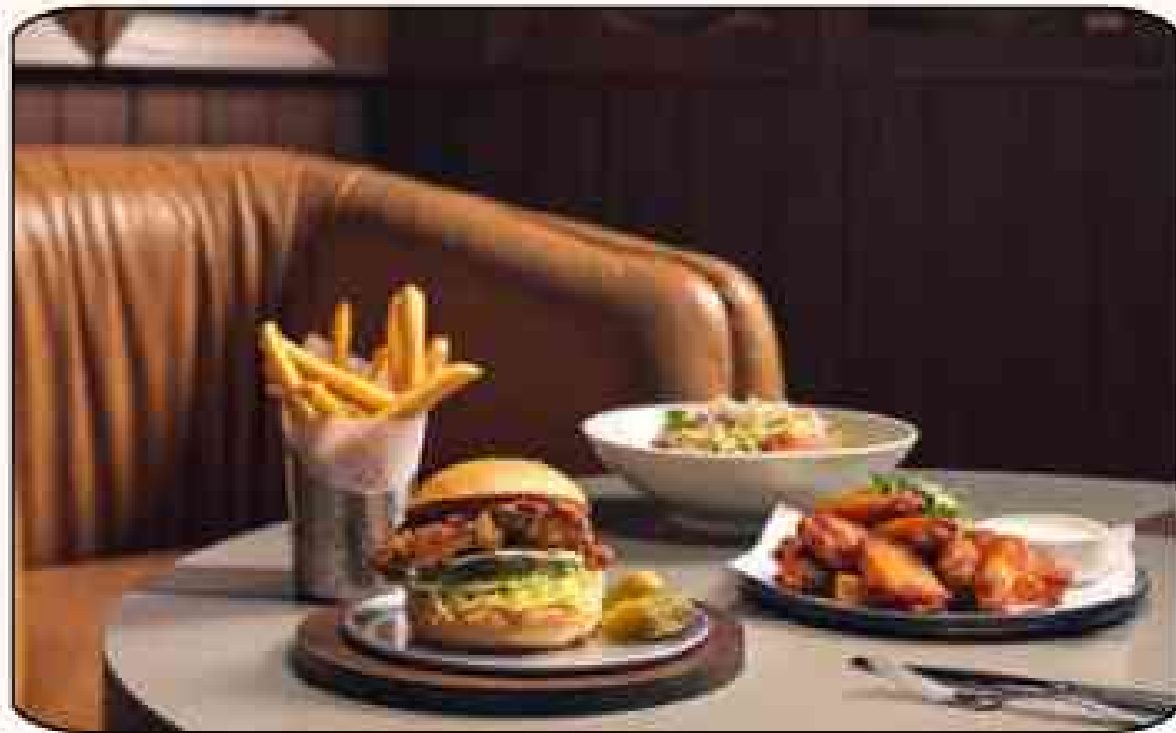
MJ23 스포츠 바 앤 그릴