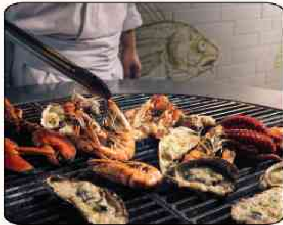
셰프스 키친 📍 로툰다 (2층)