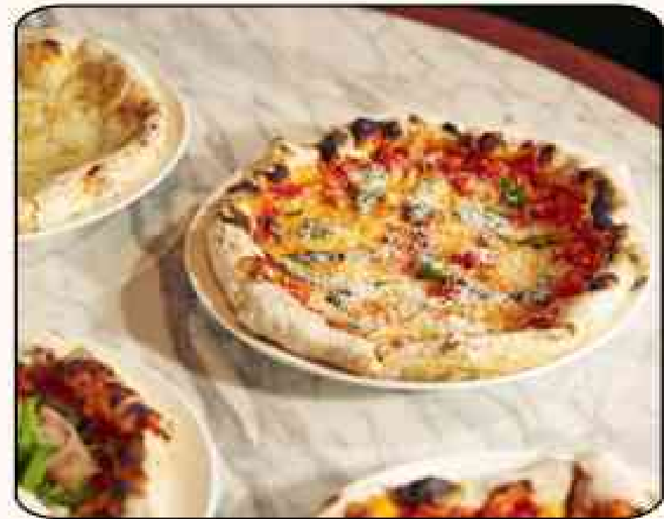
브라세리 1783 📍 시그니처 레스토랑 (1층)